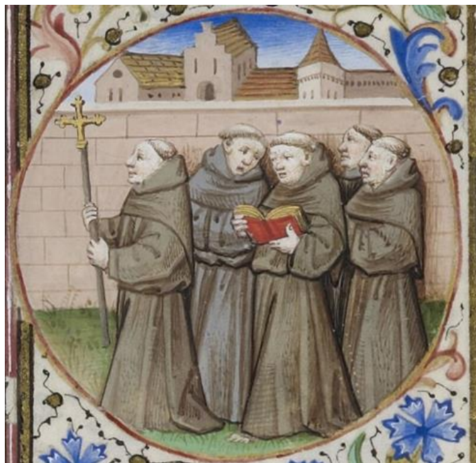
Bildet viser fransiskanermunker i en prosesjon i sine typiske grå drakter.

Frans var sønn av en rik italiensk kjøpmann som valgte et liv i frivillig fattigdom. Hans omsorg for de fattige inspirerte mange andre og førte til grunnleggelsen av ordenen.